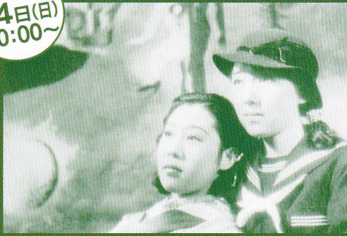
■ 浪華悲歌 1936年 第一映画 脚色 依田義賢 / 監督 溝口健二 出演者 山田五十鈴/梅村容子/大久保清子 白黒 スタンダード 72分